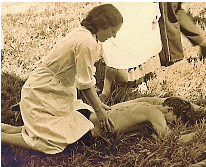
1926 Wiederbelebung nach Badeunfall