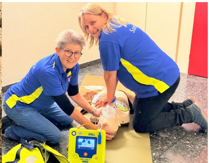
2026 Herz-Lungen-Wiederbelebung nach BLS - AED