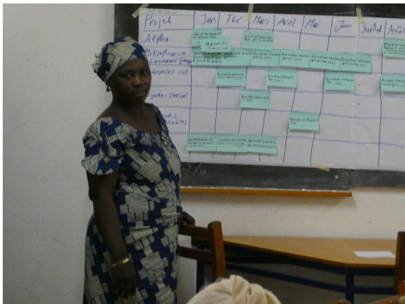
Jahresplanung im Witwenprojekt

Ein Gelände konnte bei Mora gekauft werden, ein anderes ist bei Mokolo in Aussicht. So können die Witwen auf diesen Feldern zusammen Erdnüsse, Hirse usw. pflanzen. Es ist vorgesehen, dass sich die Witwengruppen zusammenschließen und mit Anbau und Handel von Erdnüssen und ihren Produkten beginnen. Ich bin gespannt, ob das klappt.