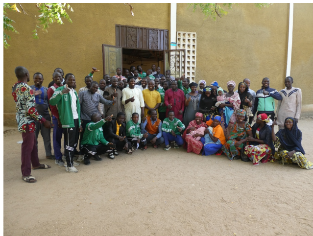
Die Studenten bedanken sich für die Unterstützung zum Ausbau des ISTEM

In der Theologischen Hochschule (Istem) gab es personelle Änderungen. Von den neuen Leitern haben wir einen guten Eindruck. Da ich eine Woche zum Thema Trauma, und einiges aus dem Bereich Gesundheit unterrichtete, bekam ich einen guten Einblick. Der Kontakt mit den Studenten war sehr interessant. Sie sind auf dem Laufenden, was in Europa so läuft und hatten viele zum Teil kritische Fragen. Ein Teil der Studenten schliesst dieses Jahr ab und geht ins Praktikum in ihren sendenden Gemeinden.