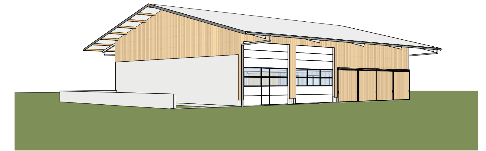
EP 3D 1